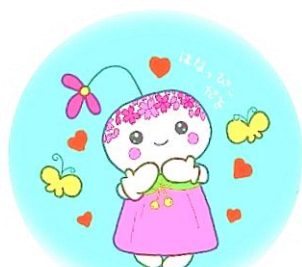
学校公式キャラクター 「はなっぴー」