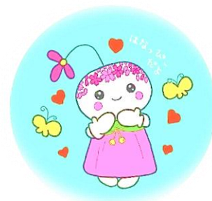
学校公式キャラクター 「はなっぴー」