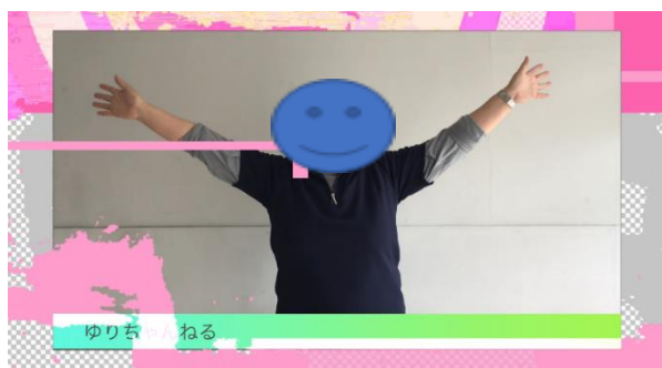
&lt;職員が作ったYouTube風動画&gt;